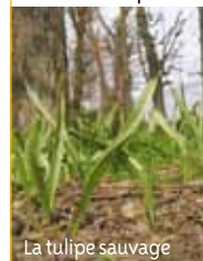
La tulipe sauvage

Au Domaine national de Saint-Cloud se trouvent deux plantes qu'il n'est pas courant de pouvoir observer : la tulipe sauvage ( Tulipa sylvestris ) et la gagée des champs ( Gagea villosa ).