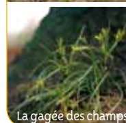
La gagée des champs

La tulipe sauvage a été redécouverte en 2007 dans les alignements de marronniers du Bas-parc, alors qu'elle n'avait plus été observée dans le Domaine depuis 1895 ; cette station fait partie des rares encore présentes en Ile-de-France.